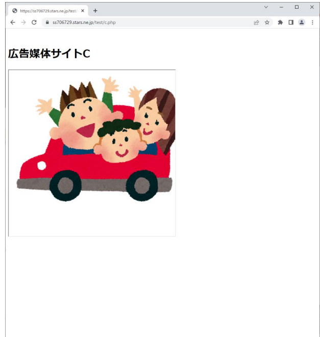
図 3 広告配信例

広告表示について、広告が表示された場合を○、広告が表示されなかった場合を×とした。cookie の埋入について、cookie が埋入された時○、cookie が拒否された時×とした。