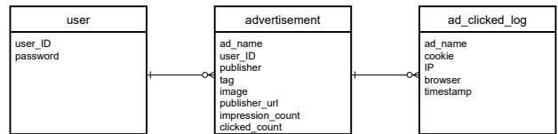
図 2 データベース構成の ER 図